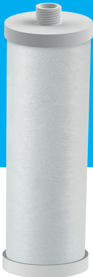
Com acabamento e rosca